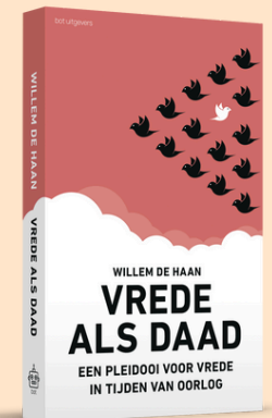
het anti-militarisme, maar om Wim de Haan: politieke op