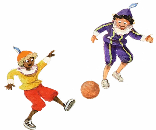
Jonge Thuispietjes uit groep 7/8